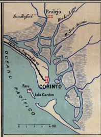
PUERTO DE CORINTO